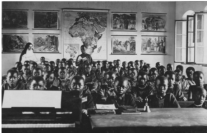
Classis puellarum in schola stationis Kwiro.

praebebatur, erat eruditio elementaria, quā maiore ex parte pauciora continuisse dicuntur quam in institutione puerorum. Classes puellarum plerumque a pueris separatae erant 24 et puellae ab Sororibus docebantur. Etiam si illis annis eruditionis gradus puellarum erat minor, ipsum factum eas ad scholas accitas esse erat progressus maximi momenti. 25 Tamen alterā ex parte iam