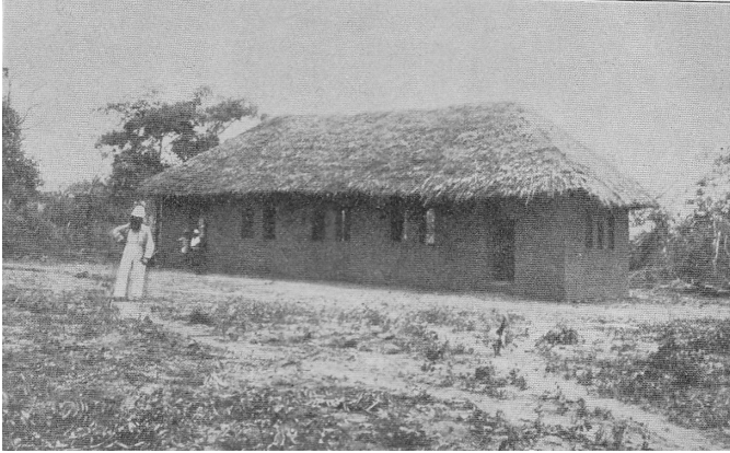
Aedificium scholare stationis Nyangao.

Quomodo autem scholae institutionesque dispositae erant? Uti iam dictum est, generaliter distinguebantur scholae principales, quae in ipsis stationibus sitae erant, atque scholae exterae. 27 Scholae stationum - saltem inde a tempo-