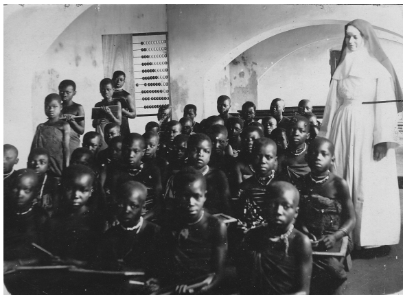
Discipulae in schola stationis Kwiros.

nem spectans, 21 quamvis initia vere simplicia essent. Tamen recordemur oportet systema aliquatenus simile in patrio seminario Ottiliensi viguisse, ubi discipuli atque futuri monachi missionarii que cottidie per certum spatium temporis manualiter laborare obligati erant. 22